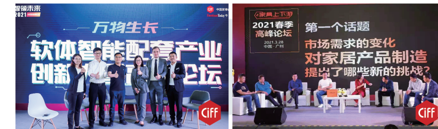
万物生长·软体智能配套产业 创新力量高峰论坛

本届设备配料展是一场大牌云集商机无限的品牌展示贸易展，也是一场快速了解行业前沿技术、趋势的思维盛宴。展会现场举办丰富多样、精彩纷呈的专业论坛及活动，聚焦行业热点话题，深入探讨新材料新技术带来的无限可能性，让现场观众深刻感受关于材料创新、技术研发的魅力。