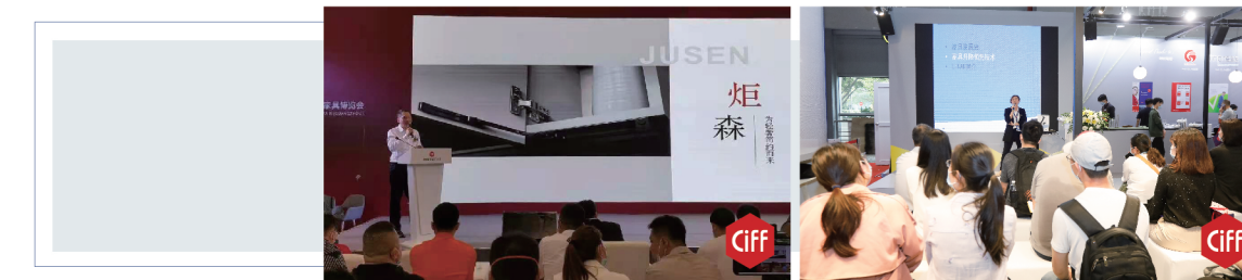
为轻奢极简而来——赋能高定，共炬未来